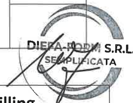
Tabella moduli Tecnico-professionali - PERCORSO 3 Reskilling

Certificazione in uscita: Attestazione delle competenze acquisite (Attestato di frequenza e profitto con messa in trasparenza degli apprendimenti) in coerenza con gli standard definiti dalla circolare ANPAL 5.8.2022 n. 1